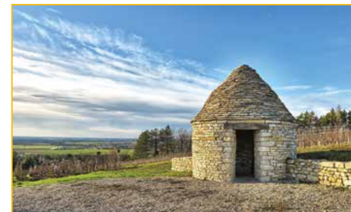
Extrait de « Cramans au Val D'Amour » édité chez Cêtre Besançon

L'Association des Vignerons du Haut Val d'Amour, voulant maintenir la protection et la valorisation du patrimoine vinicole, a mis en place une superbe vigne conservatoire sur la colline dominant le village.